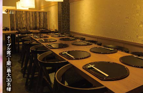
テーブル席(1階)最大30名様