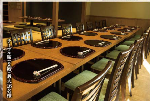
テーブル席(2階)最大16名様