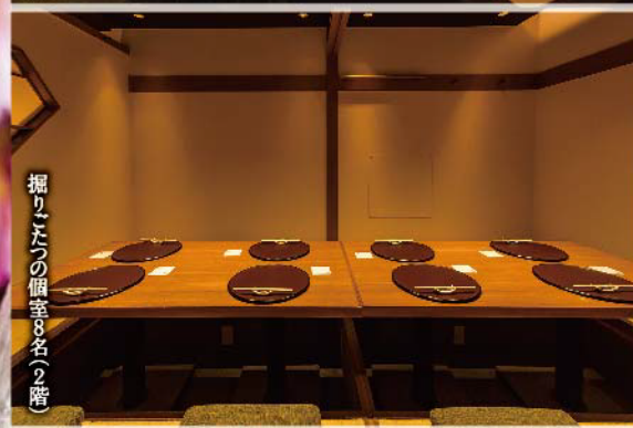
掘りこたの個室(8名~9階)